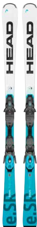
Race-Carver Head E.SR Rebels Ti + PR11 GW