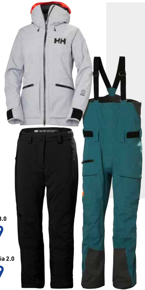
Helly Hansen Skijacke Powderqueen 3.0 449,99