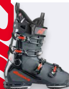
Nordica Speedmachine 3 110X GW / 95X W GW