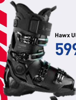
Hawx Ultra 130 S GW 599,99