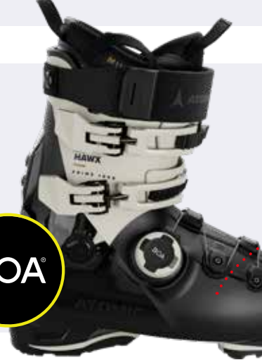
Atomic Hawx Prime 105 S BOA W GW 599,99