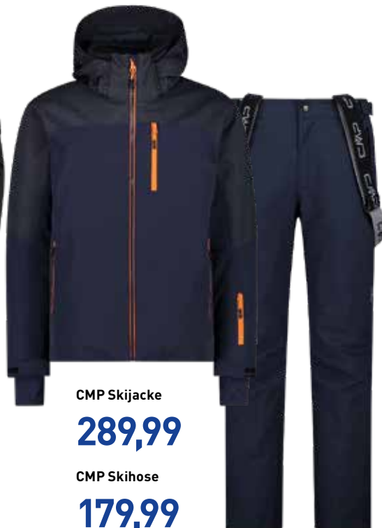
CMP Skijacke 289,99