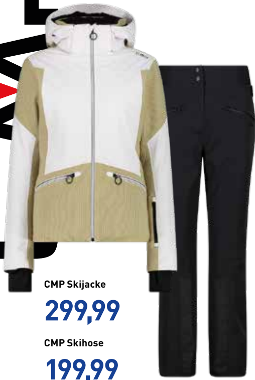
CMP Skijacke 299,99