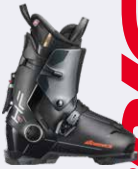
Nordica HF 110 GW / 85 W GW 499,99