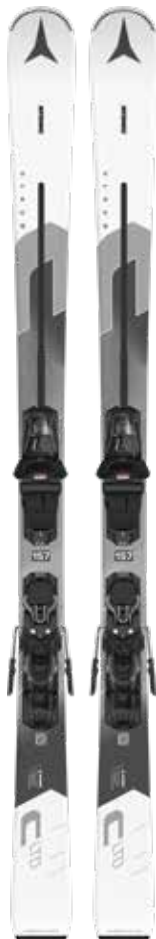
Lady-Carver Atomic Cloud LTD + M10 GW