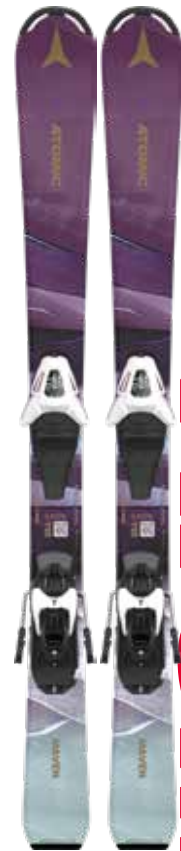
All-Mountain Atomic Maven Girl 80-120 + C 5 GW