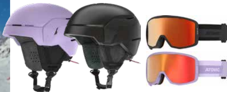
Skihelm Atomic Count JR 99,99