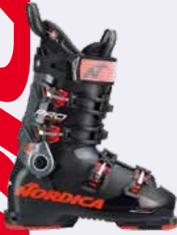
Nordica Pro Machine 120 X GW / 105 X W GW 459,99