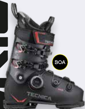
Tecnica Mach BOA HV 110X GW / 95X W GW