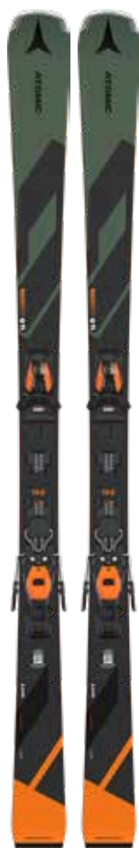
All-Mountain Atomic Redster Q Ti + M10 GW