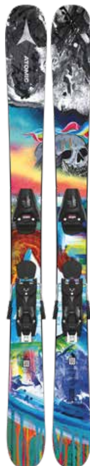
All-Mountain Atomic Bent Chetler Mini 133-163 + Colt 7 GW