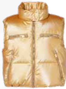
Bodywarmer Goldbergh Eclat 449,99