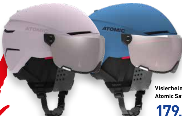
Visierhelm Atomic Savor JR Visor 179,99