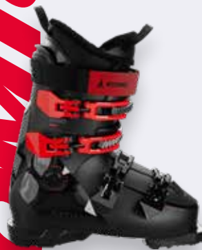
Atomic Hawx 100X GW / 95X W GW