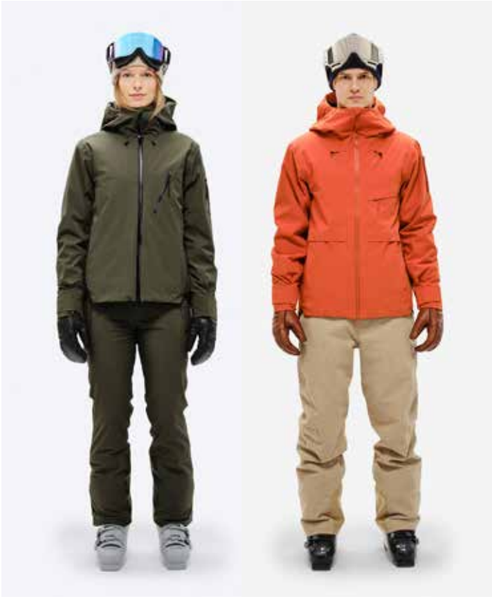
Skijacke 2L Stretch Insulated